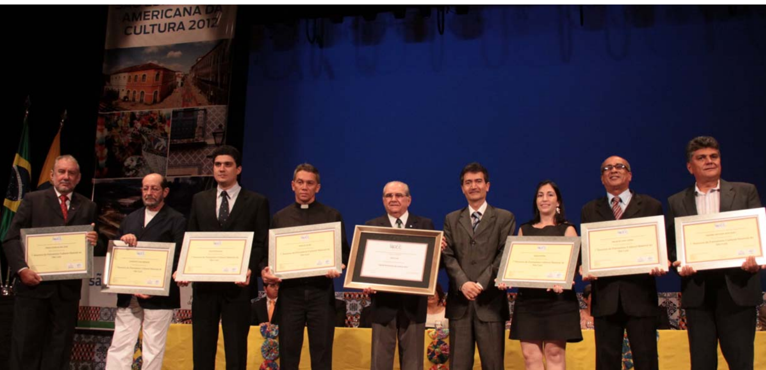
Cerimònia de lliurament dels diplomes acreditatius dels 7 tresors del patrimoni cultural de São Luís, celebrada al Teatre Arthur Azevedo