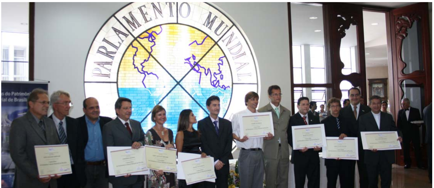
Cerimònia de lliurament dels diplomes als representants dels 7 tresors de Brasília, acte celebrat al Temple de Bona Voluntat