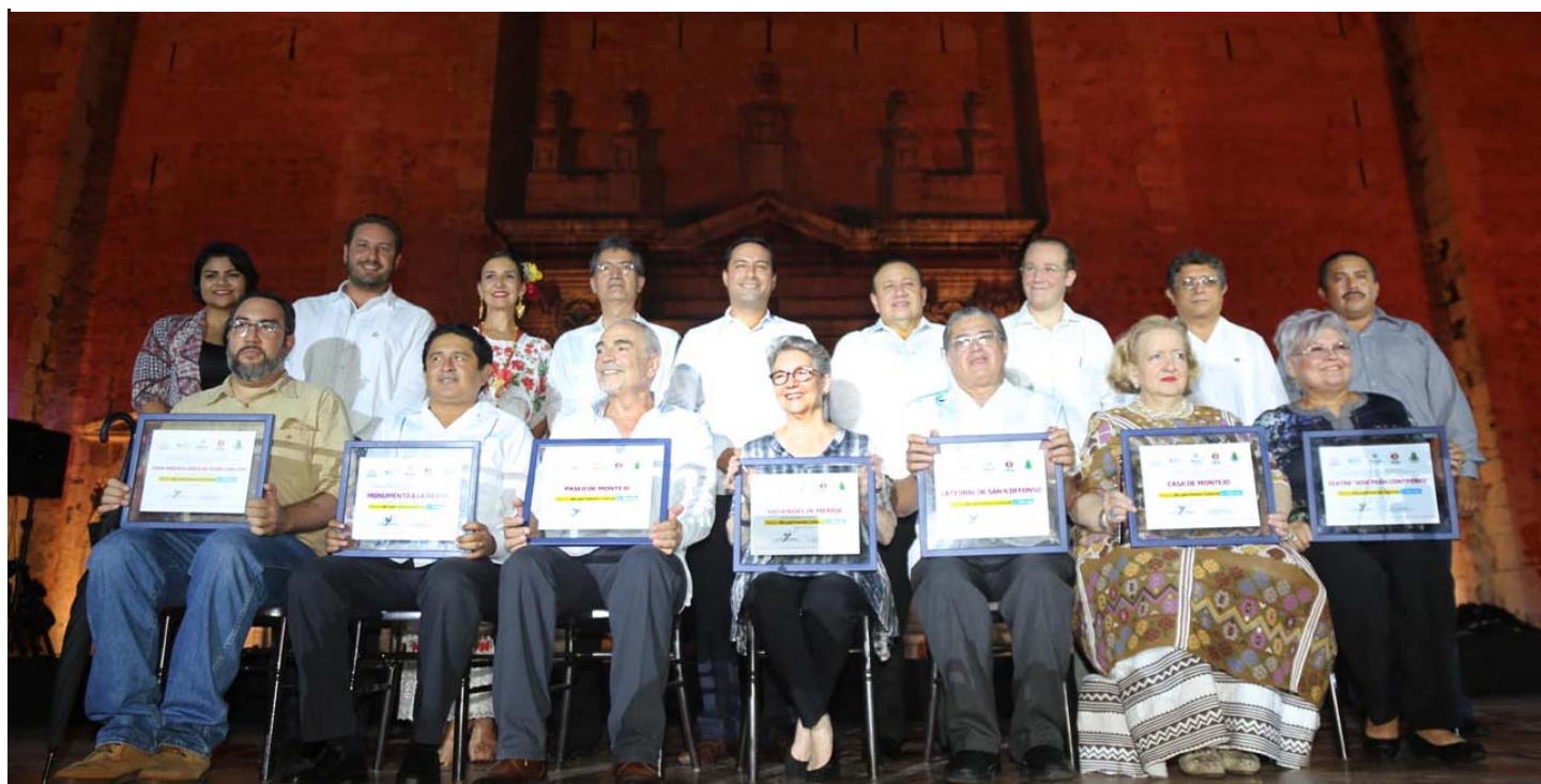
Cerimònia de lliurament dels diplomes als representants dels tesoros de Mérida, acte celebrat davant la Catedral de Yucatán