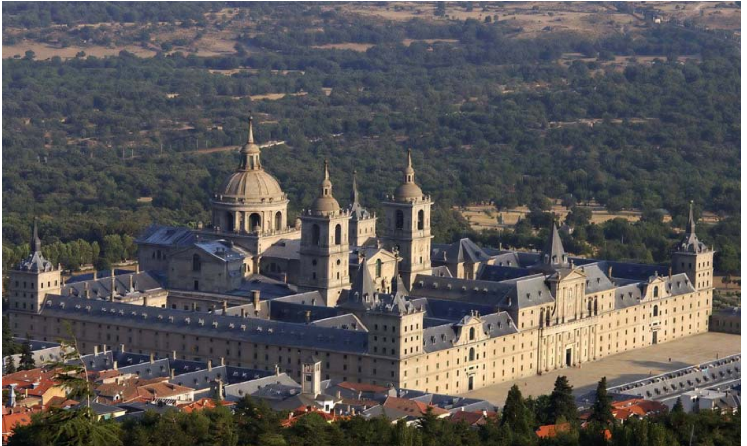
Monestir de San Lorenzo del Escorial