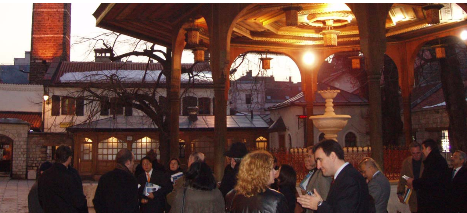
Barri antic de Sarajevo (Bascarsija)