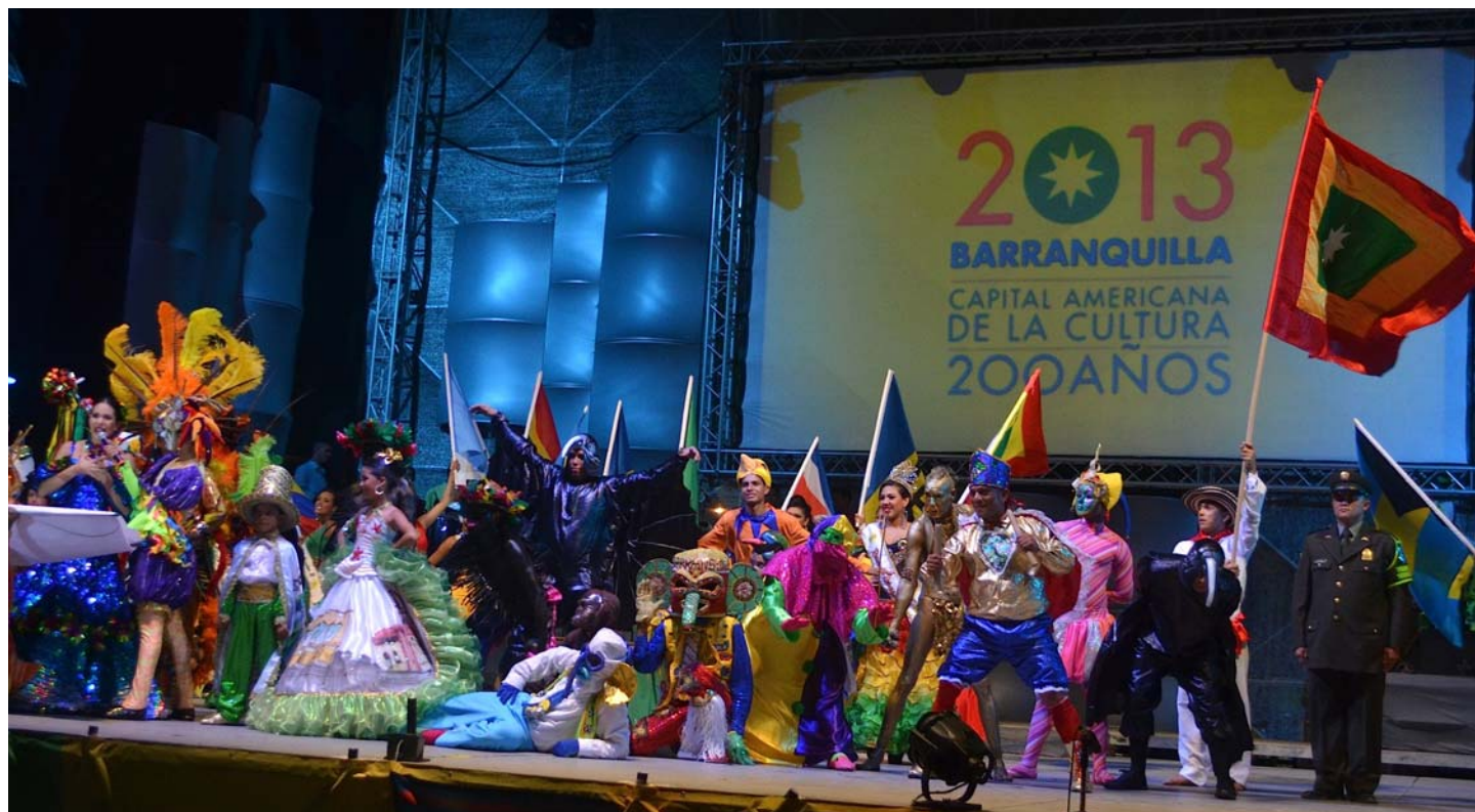
Carnaval de Barranquilla