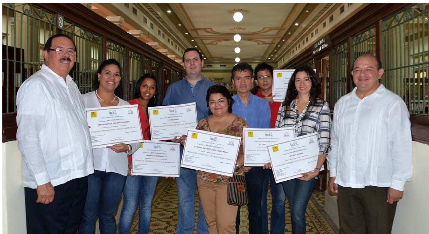
Lliurament dels diplomes acreditatius dels 7 tresors del patrimoni cultural de Barranquilla, acte celebrat a l'edifici de l'antiga duana