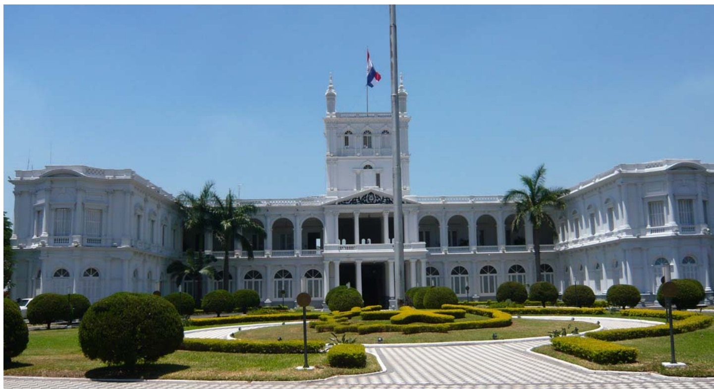
Palau dels López