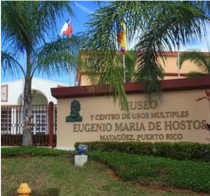
Museo Eugenio María de Hostos