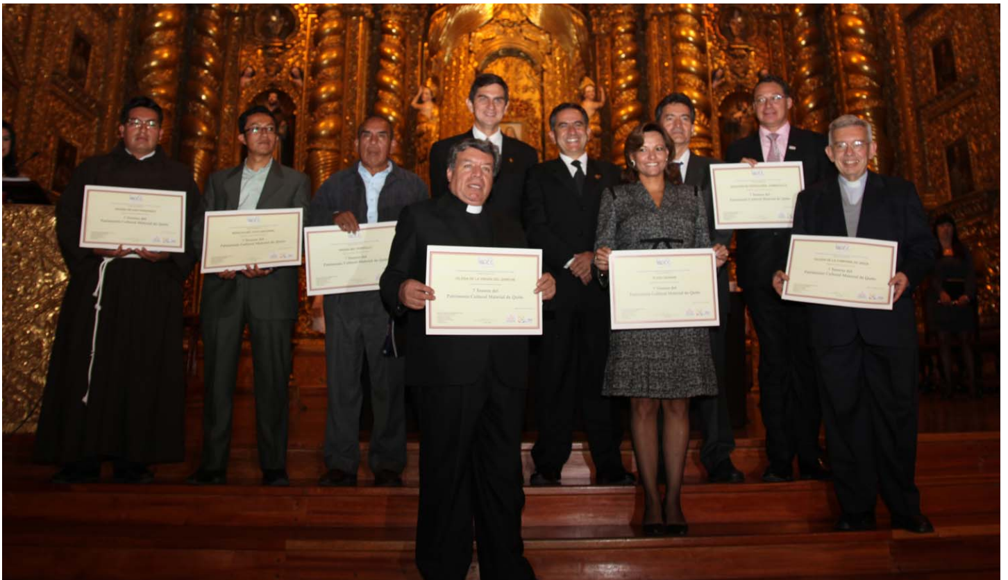
Cerimònia de lliurament dels diplomes als representants dels elements elegits com a tresor del patrimoni cultural de Quito celebrada a l'Església de la Companyia de Jesús de la capital equatoriana