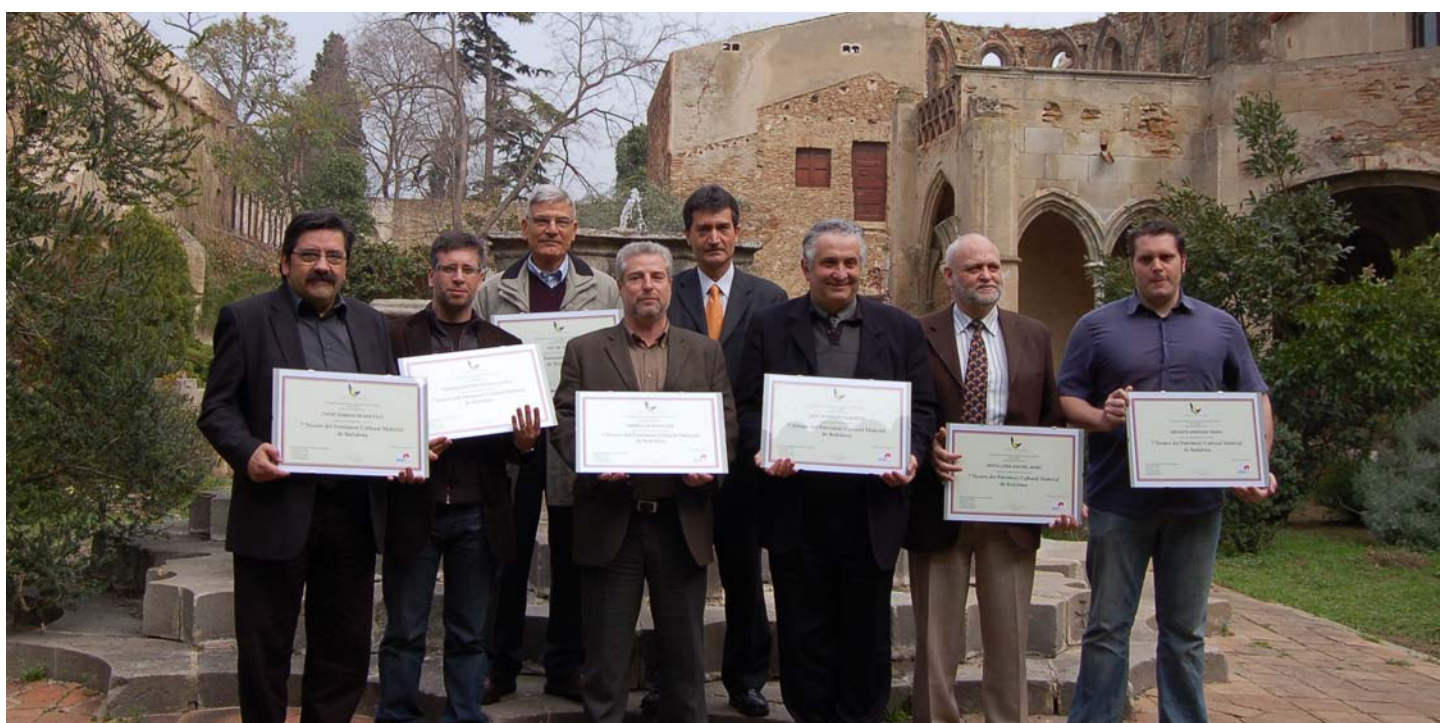
Acte de lliurament dels diplomes acreditats als representants dels 7 tresors del patrimoni cultural de Badalona, celebrat al monestir de Sant Jeroni de la Murtra