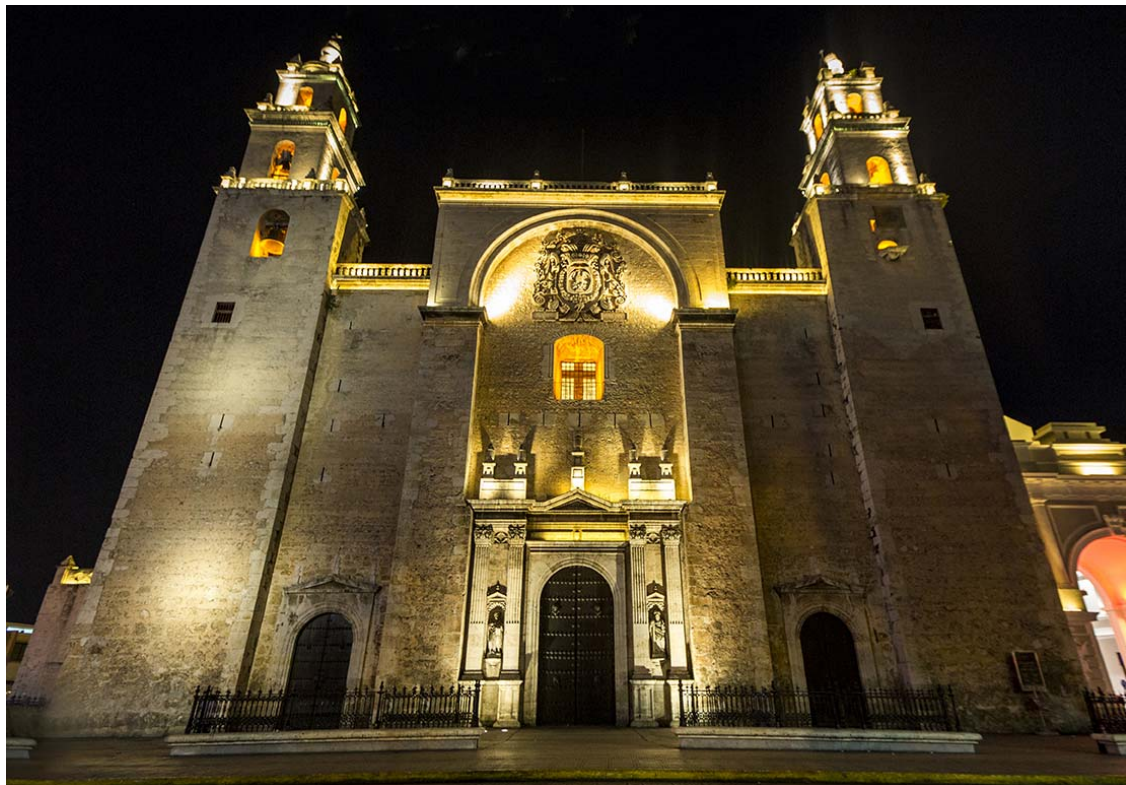
Catedral de Yucatán