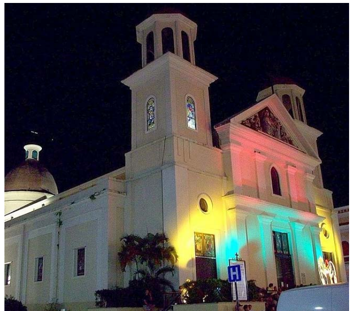
Catedral de la Candelària