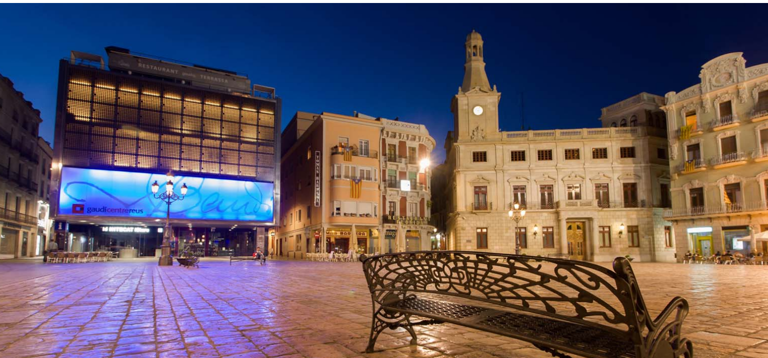
Plaça del Mercadal