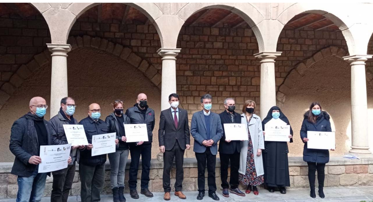
Acte de lliurament dels diplomes acreditatius als representants dels 7 Tresors del Patrimoni Cultural d'Igualada, celebrat el dia 12 de gener de 2022 al claustre de l'Escola Pia d'Igualada

Claustre de l'Escola Pia La Festa dels Reis El Museu del Tren Railhome Barcelona L'Asil del Sant Crist El Museu del Traginer La Basílica de Santa Maria L'Antic Escorxador Ateneu Igualadí de la classe Obrera Els Tres Tombs El Rec La Plaça de la Porxada El Museu de la Pell d'Igualada L'Ermита de Sant Jaume de Sesoliveres La Mostra d'Igualada - Fira d'espectacles infantils i juvenils El Portal d'en Vives i de la Font Major La Festa Major de Sant Bartomeu d'Igualada El Casino Foment La Igualadina Cotonera El Cementiri Nou La Vila Romana de l'Espelt