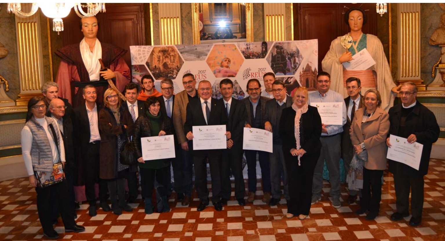
Cerimònia de lliurament dels diplomes acreditatius als representants dels elements elegits com a tresor del patrimoni cultural de Reus celebrada al Palau Bofarull el dia 13 de desembre de 2016