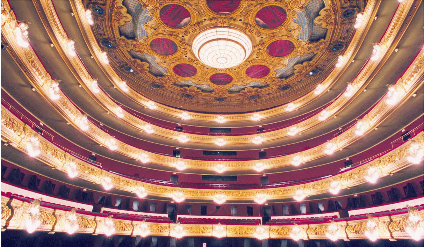
Gran Teatre del Liceu