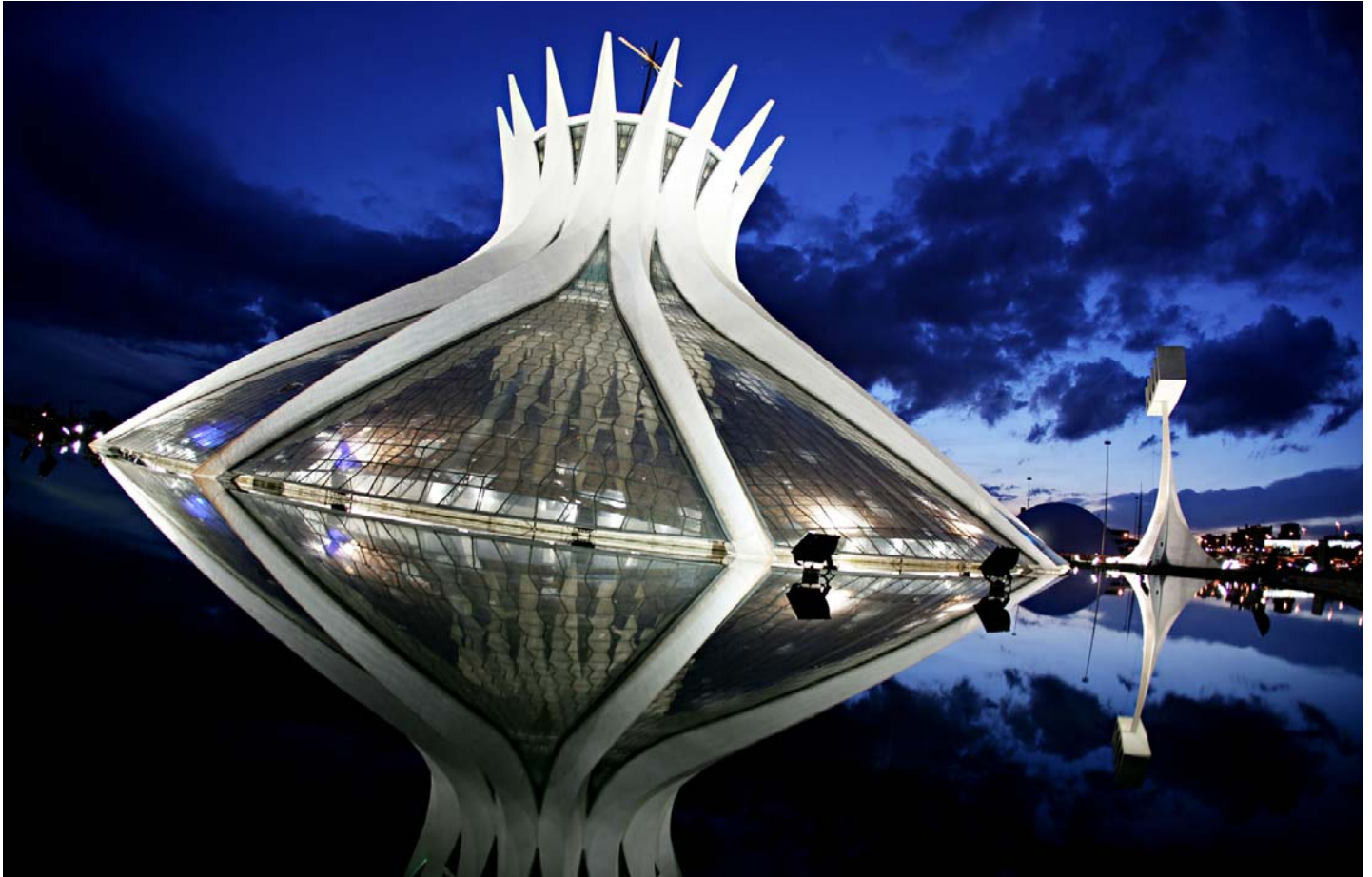
Catedral de Brasília