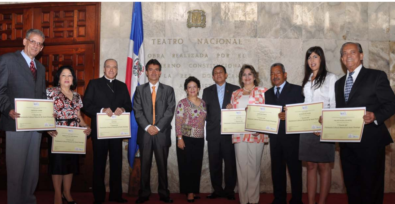
Cerimònia de lliurament dels diplomes als representants dels elements elegits com a tresor del patrimoni cultural de Santo Domingo celebrada al Teatre Nacional de la República Dominicana