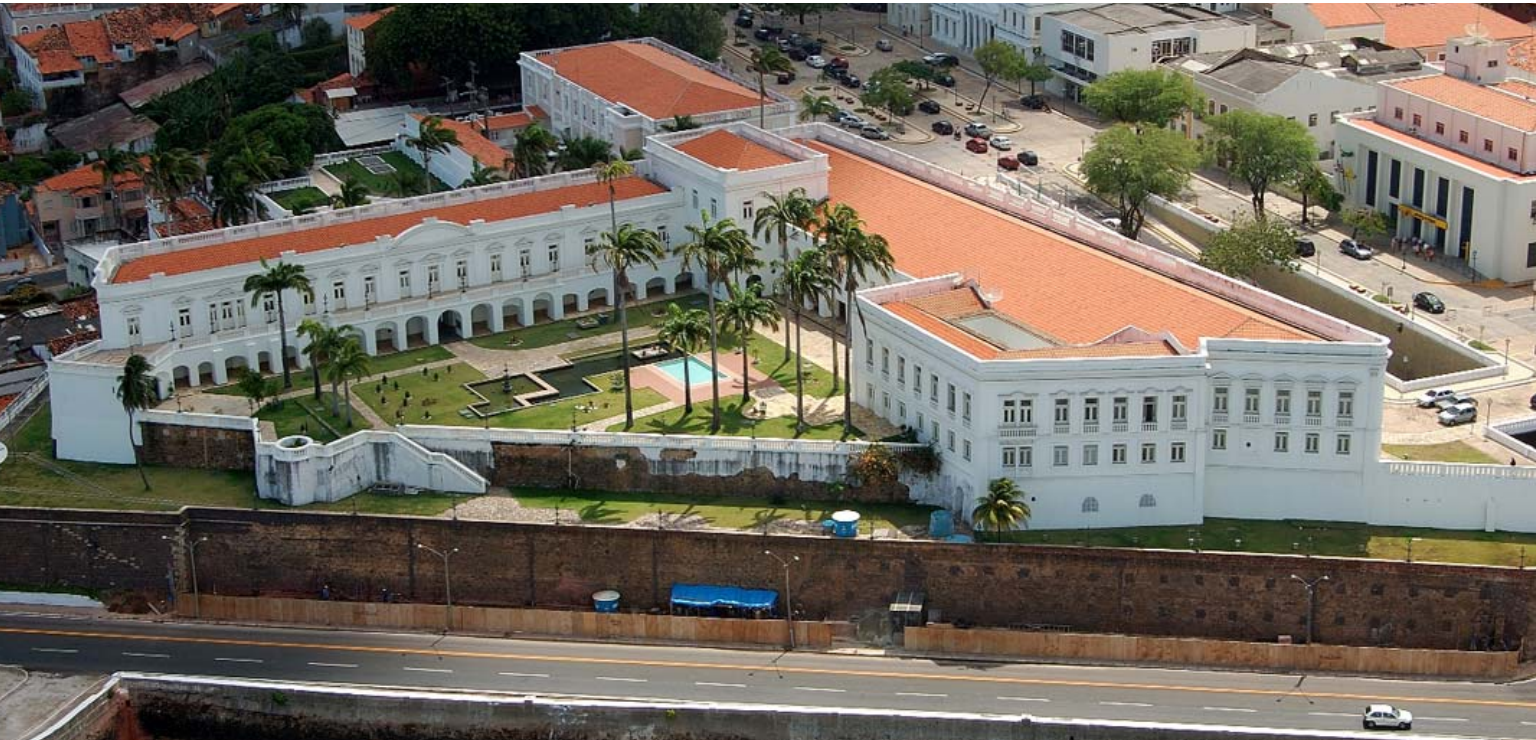
Palau dels Lleons