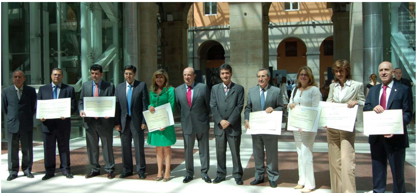
Lliurament dels diplomes acreditatius als representants del 7 tresors culturals de la Comunitat de Madrid, acte celebrat a la seu de la presidència d'aquesta comunitat autònoma