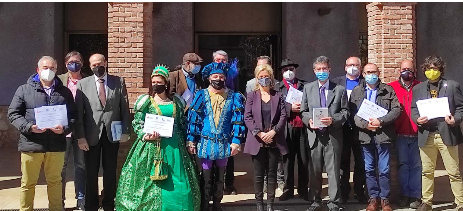
Fotografia dels representants dels elements elegits tesor del patrimoni cultural de Tortosa celebrada al Museu de Tortosa