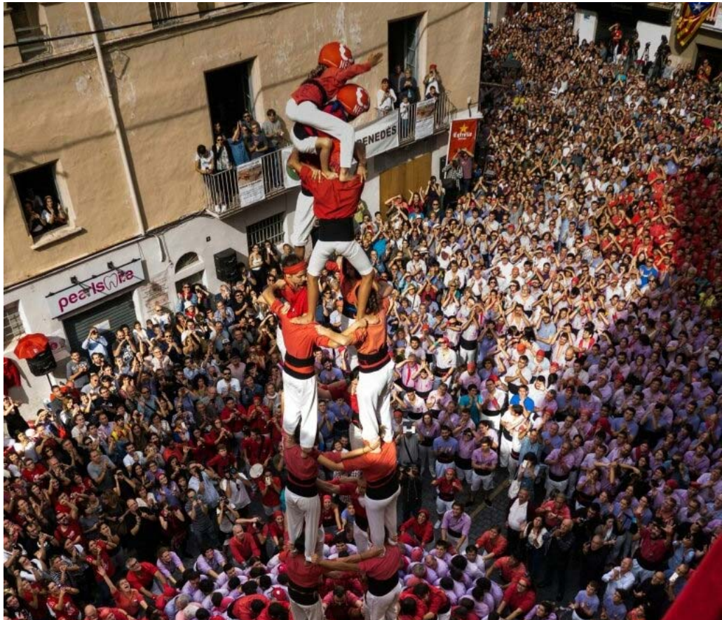
Nens del Vendrell