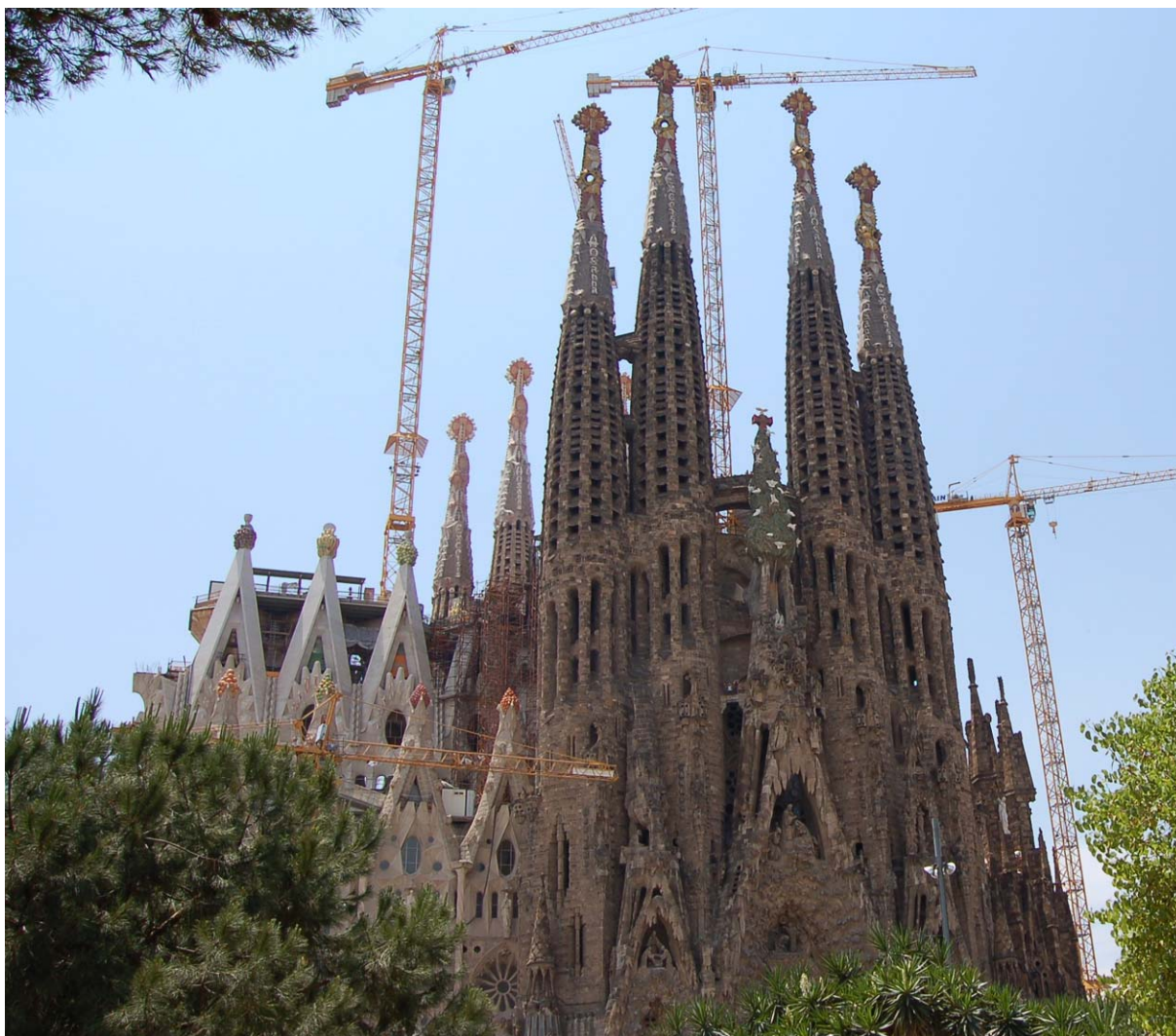
Temple Expiatori de la Sagrada Família de Barcelona