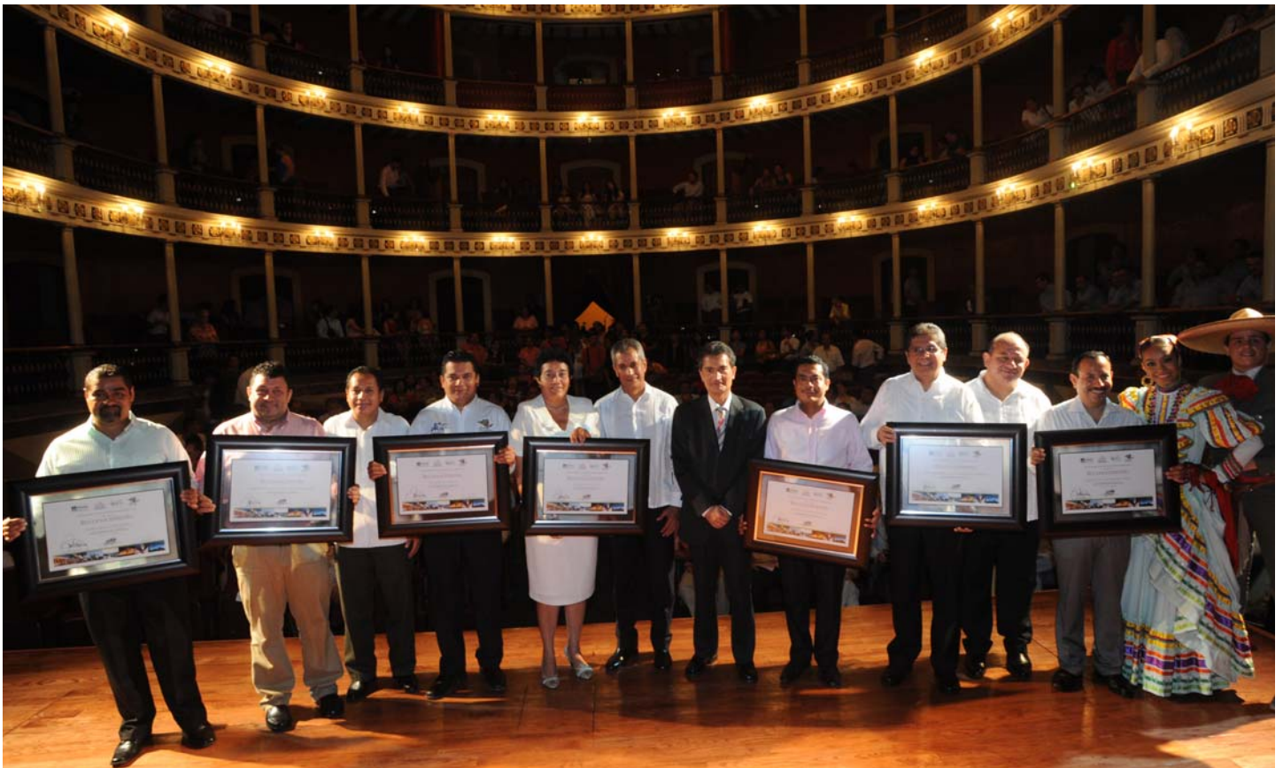
Cerimònia de lliurament de diplomes als representants dels 7 tesoros culturals de l'estat de Colima celebrada al Teatre Hidalgo