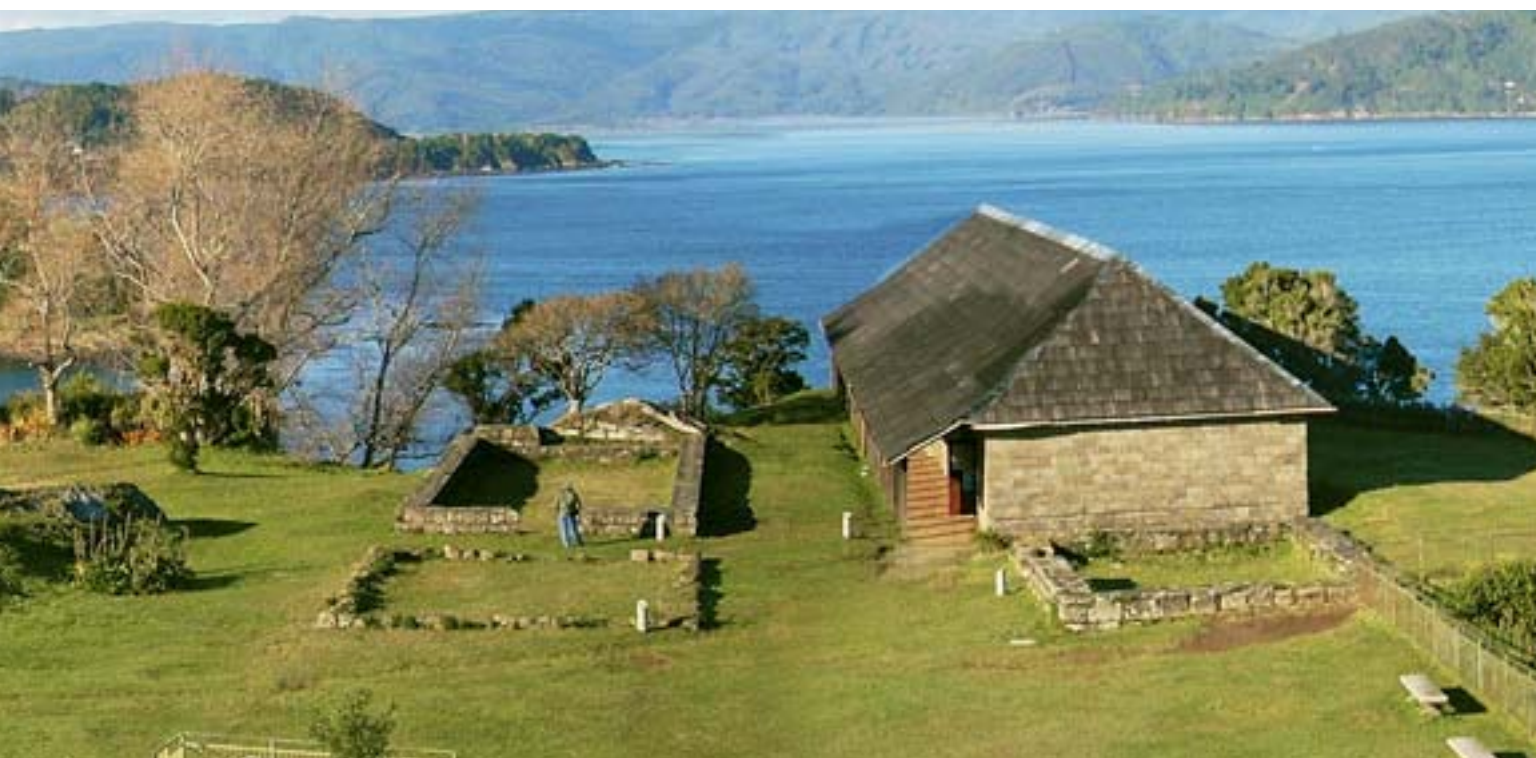
Fortí de Niebla