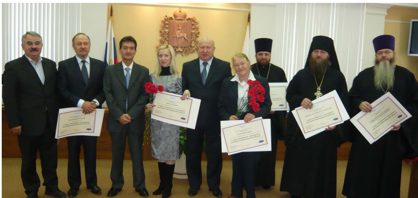
Cerimònia de lliurament dels diplomes als representants dels tresors de Nizhny Novgorod celebrada a la seu de la presidència d'aquesta regió russa