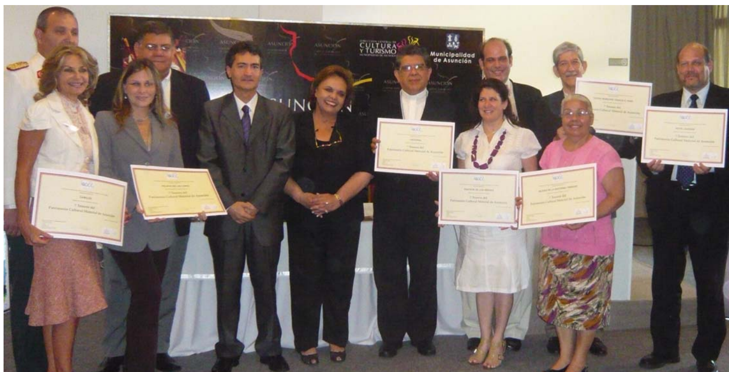
Acte de lliurament dels diplomes acreditatius als representants dels 7 tresors del patrimoni cultural d'Asunción