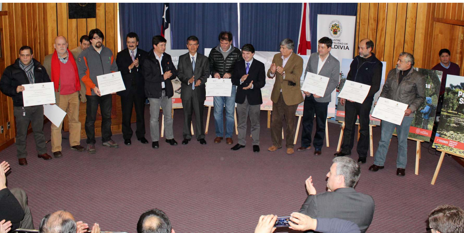
Cerimònia de lliurament al municipi de Valdivia dels diplomes als representants dels elements elegits com a tresor cultural d'aquesta ciutat