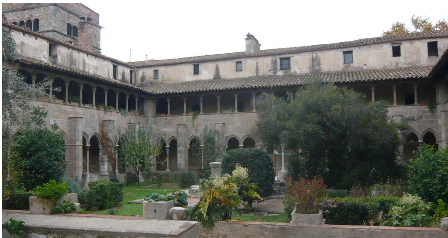
Monestir de Sant Jeroni de la Murtra