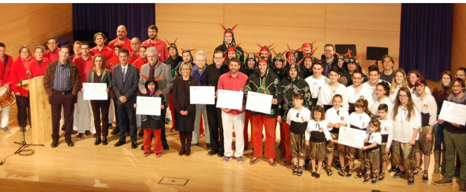
Acte de lliurament dels diplomes als representants del elements elegits com a tresor cultural del Vendrell, celebrat el dia 14 de gener de 2017