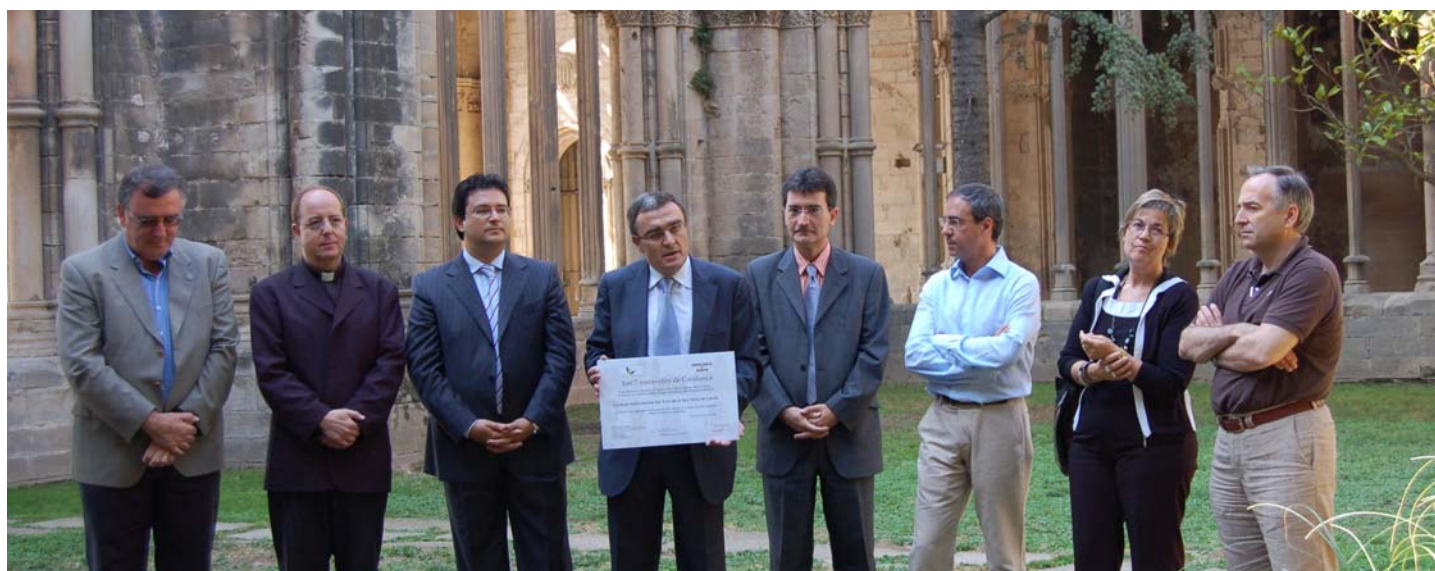
Cerimònia de lliurament del diploma al Conjunt Monumental del Turó de la Seu Vella de Lleida