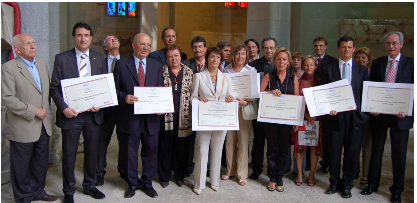
Cerimònia de lliurament de diplomes als representants dels tresors de Barcelona, acte celebrat al Temple Expiatori de la Sagrada Família