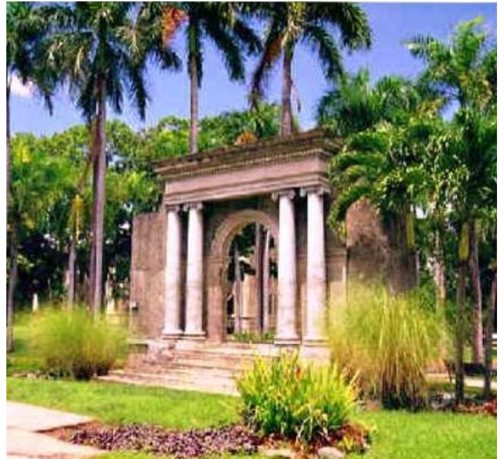
Pòrtic del Recinte Universitari de Mayagüez