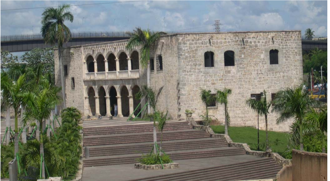
Alcàsser de Colom