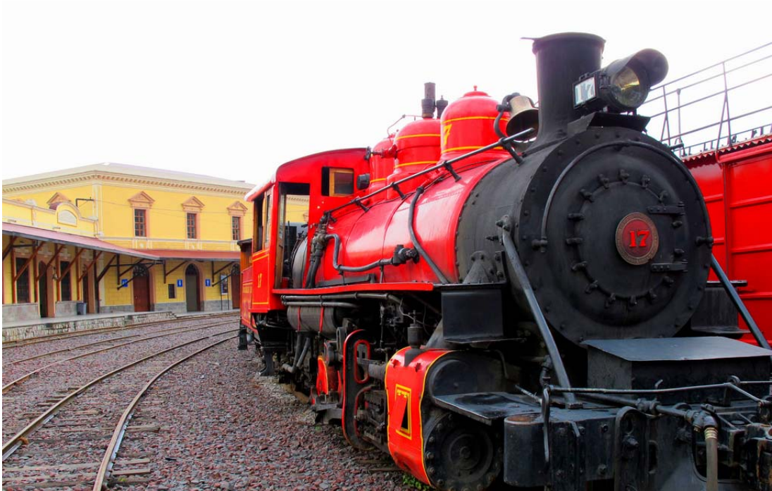
Estació de ferrocarril Eloy Alfaro