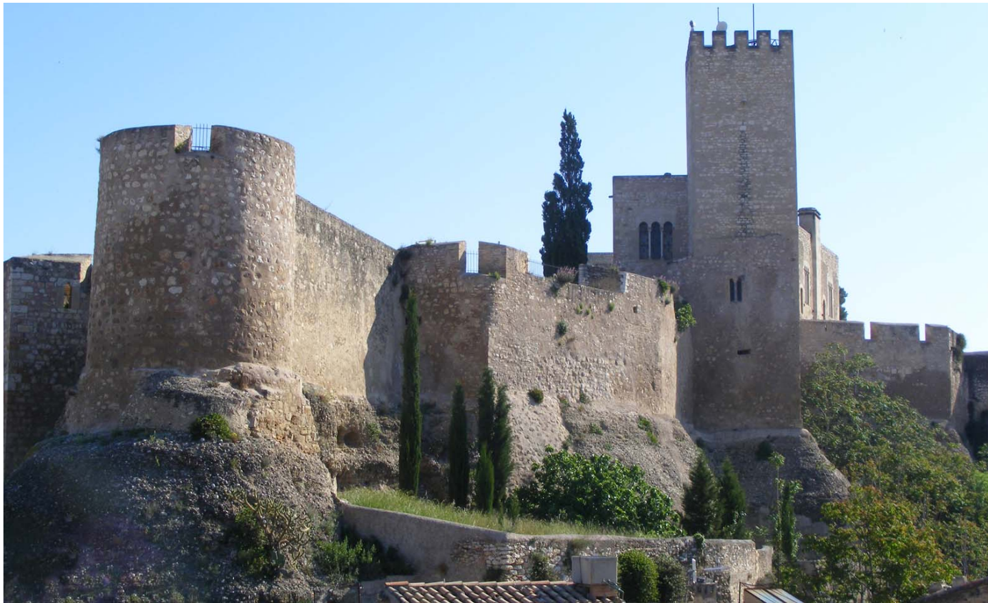
Suda i les muralles i fortificacions de la ciutat